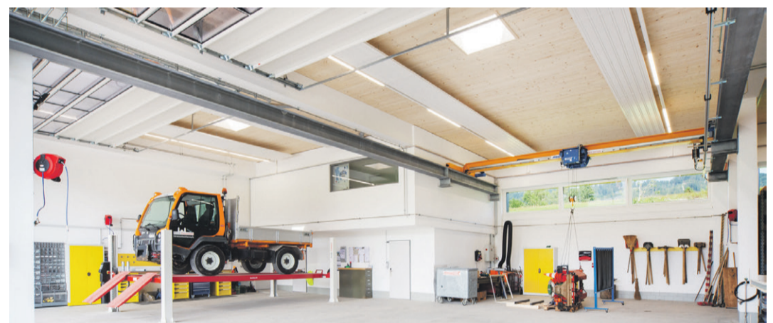
Werkhalle Strassenunterhalt mit eigenem Fahrzeugreparaturbereich und Schweisplatz