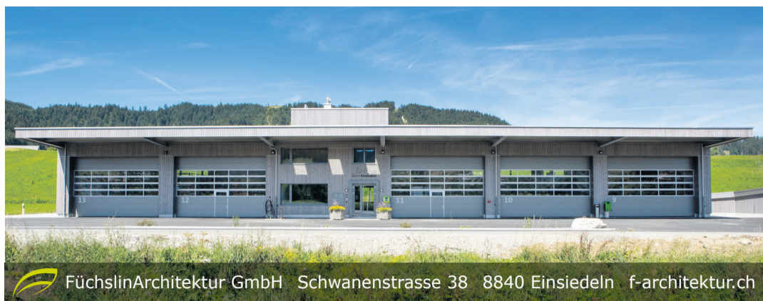
FüchslinArchitektur GmbH Schwanenstrasse 38 8840 Einsiedeln f-architektur.ch