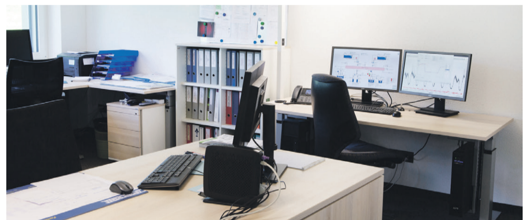
Zeitgemässe Arbeitsplätze / Leitwarte Wasserversorgung

Peter Füchslin FüchslinArchitektur GmbH, Einsiedeln