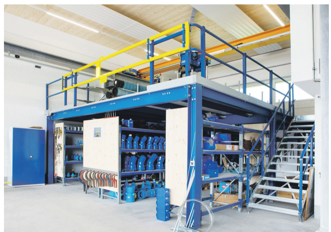
Rohrlager der Wasserversorgung

Meinrad Gyr, Ressortchef Infrastruktur des Bezirks Einsiedeln