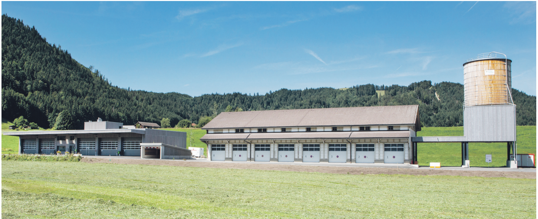
Ostansicht des gesamten Werkareals mit neuem Werkhof, altem Zeughaus, Grobwaschplatz und Salzsilo