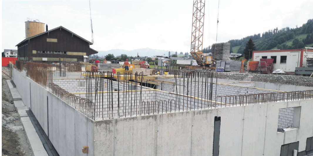
Das Untergeschoss im Rohbau