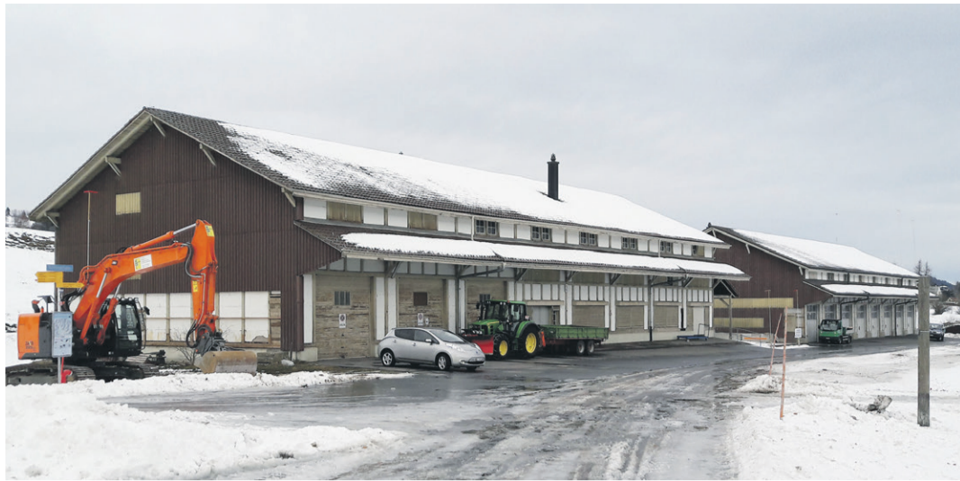
Das alte Zeughaus Süd kurz vor dem Abbruch