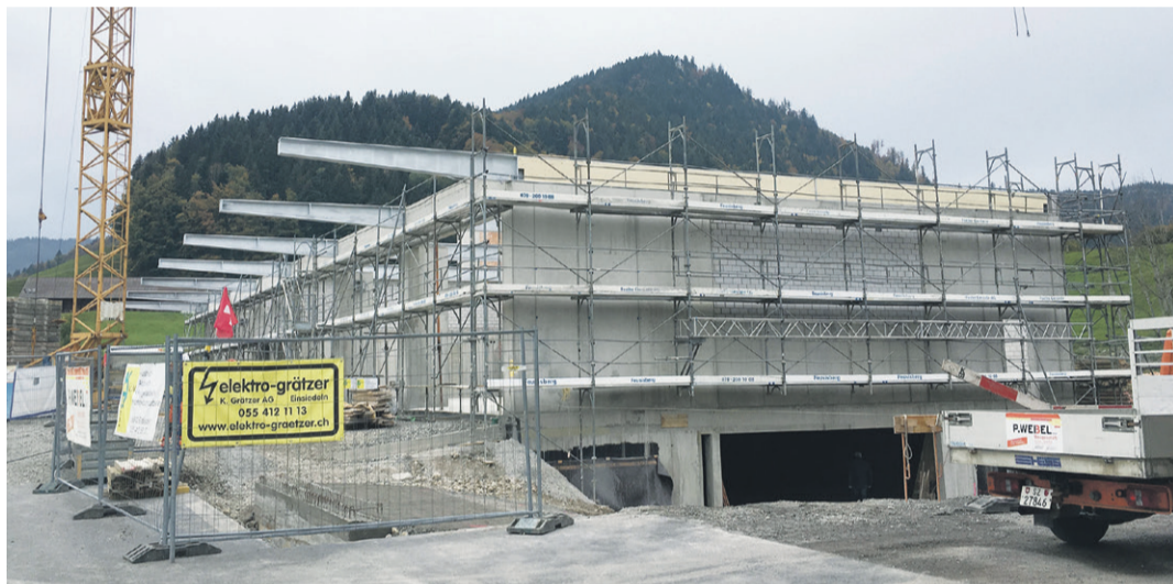
Der Rohbau vor dem Verlegen der Holzdach-Elemente