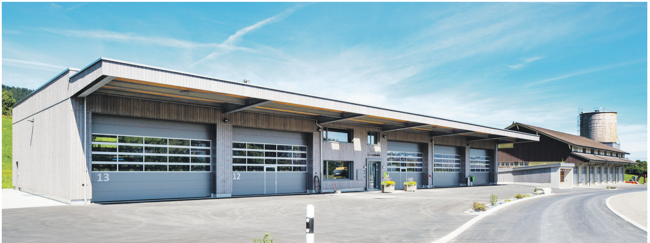
Im Vordergrund der neue Werkhof, in der Mitte das Alte Zeughaus und im Hintergrund das neue Salzsilo