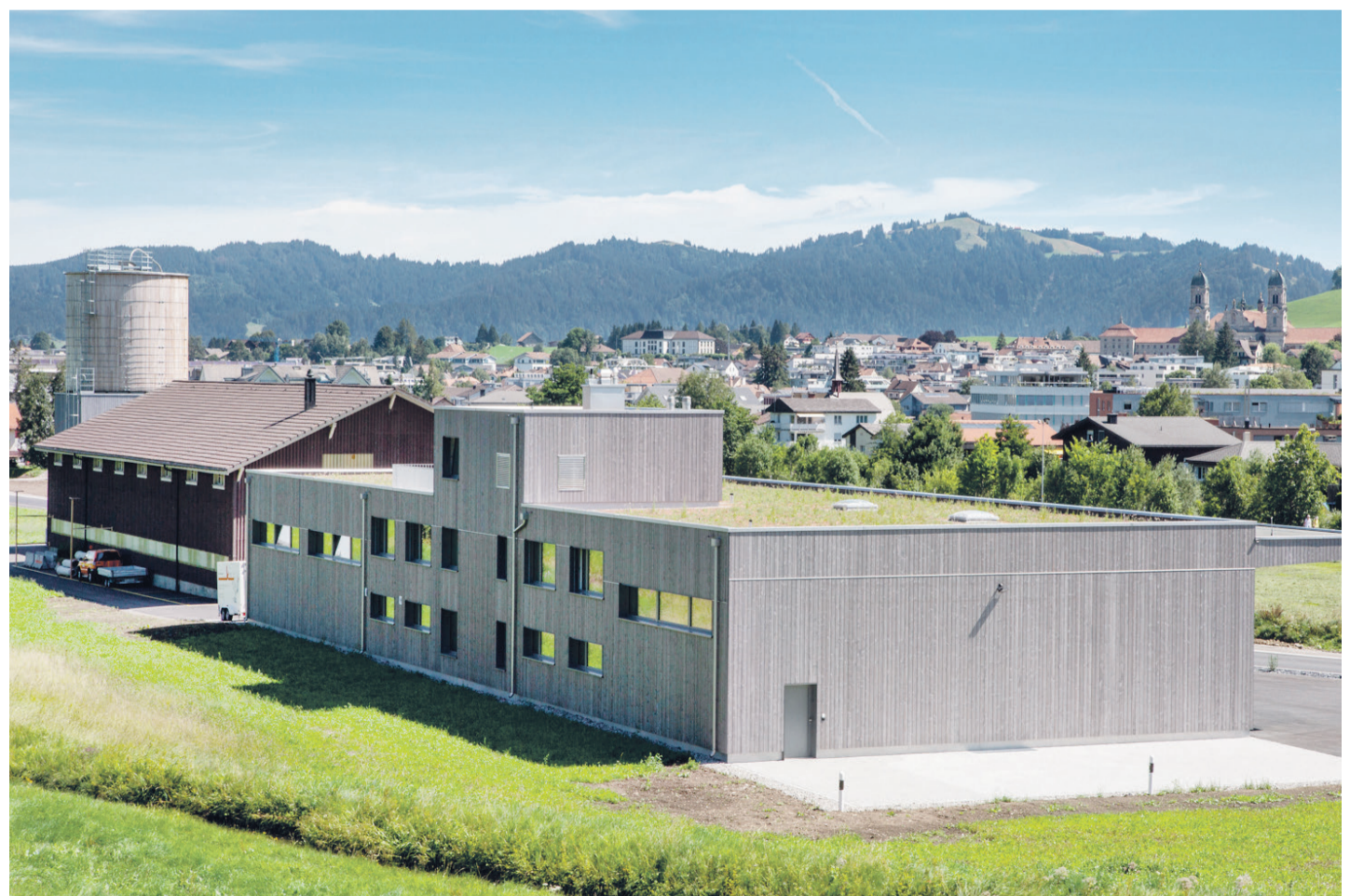
Blick vom Bolzberg Richtung Dorf