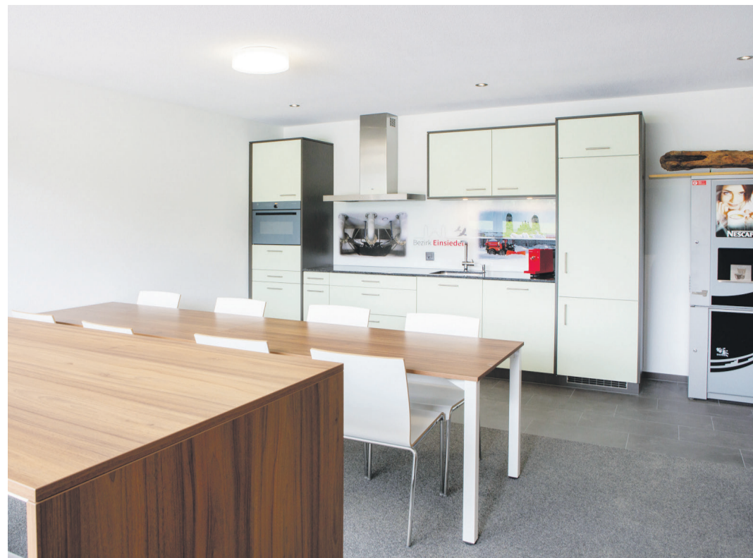
Gemeinsamer Aufenthaltsraum Strassenunterhalt und Wasserversorgung