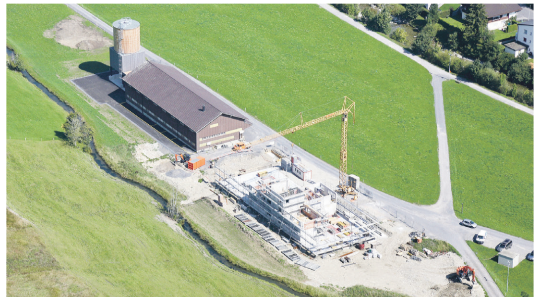
Luftaufnahme während des Rohbaus

Kapitel II: Kritik (Kosten) und Ansprüche (Raumbedarf, Foto-